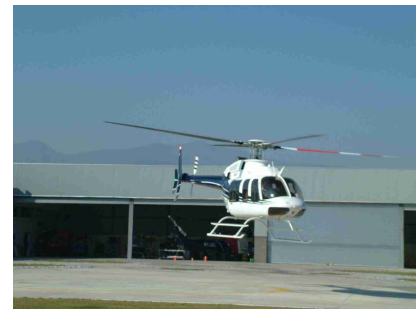
Helicóptero Bell 407 Año 2011 – ACTT 1497