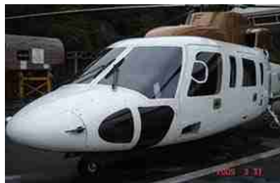
Helicóptero Sikorsky S76C+ Año 1997 – ACTT 14.700