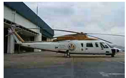
Helicóptero Sikorsky S76C+ Año 1997 – ACTT 15.100