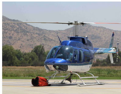
Helicoptero 206L1 Año 1979 – ACTT 9615