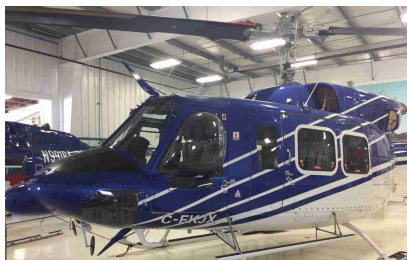
Helicóptero Bell 212 Año 1976 – ACTT 14.385