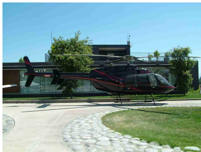
Helicóptero Bell 407 Año 2008 – ACTT 1015